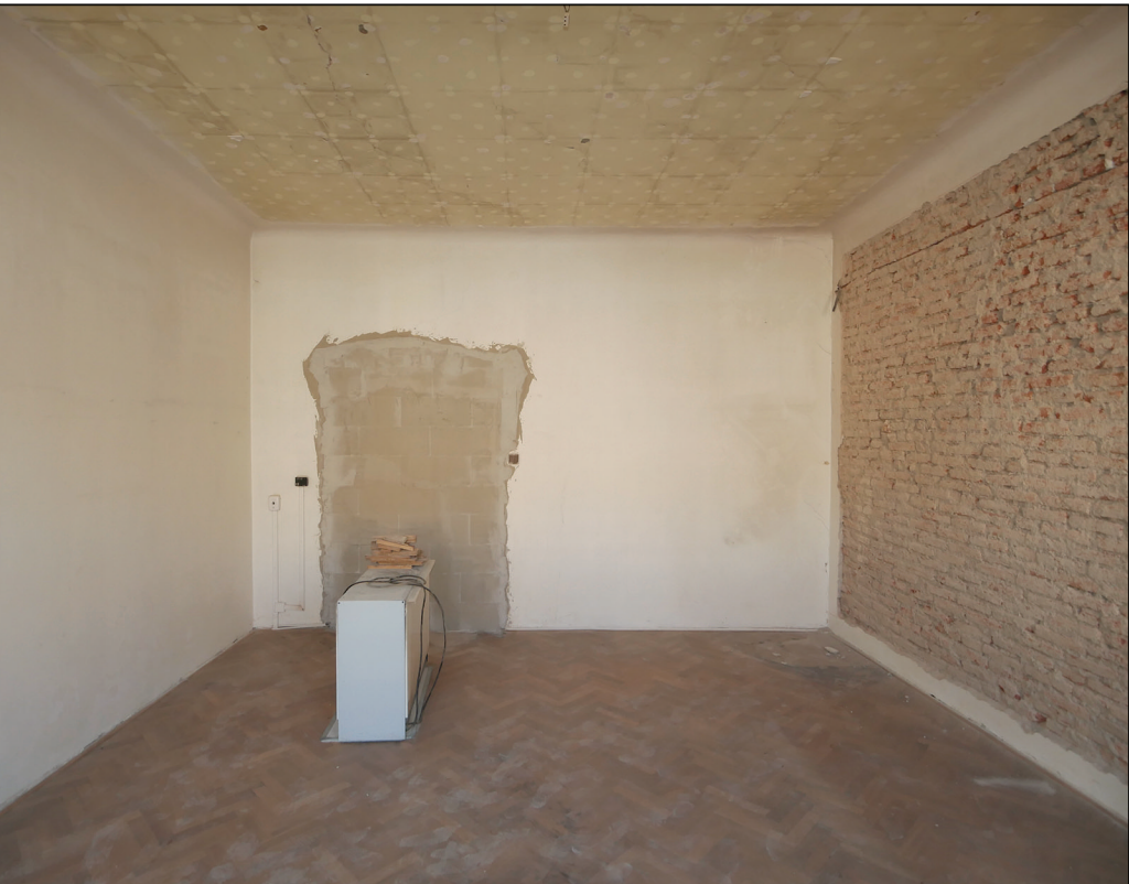
MÍSTNOST 04 ložnice, zazděný dveřní otvor do předsíně č.05. Vpravo neomítnutá sousední zeď z nedokončené rekonstrukce posledním nájemcem