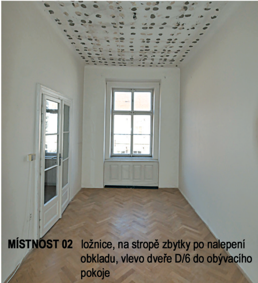
MÍSTNOST 02 ložnice, na stropě zbytky po nalepení obkladu, vlevo dveře D/6 do obývacího pokoje