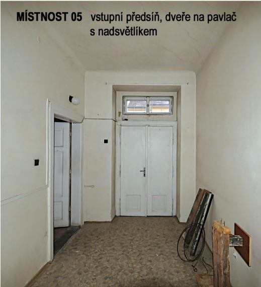
MÍSTNOST 05 vstupní předsíň, dveře na pavlač s nadsvětlíkem