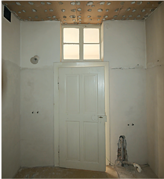
MÍSTNOST 06 koupelna, snížený pohled ze sololitových desek, vlevo pod stropem odvětrání koupelny rourou přes společnou místnost záchodů na fasádu