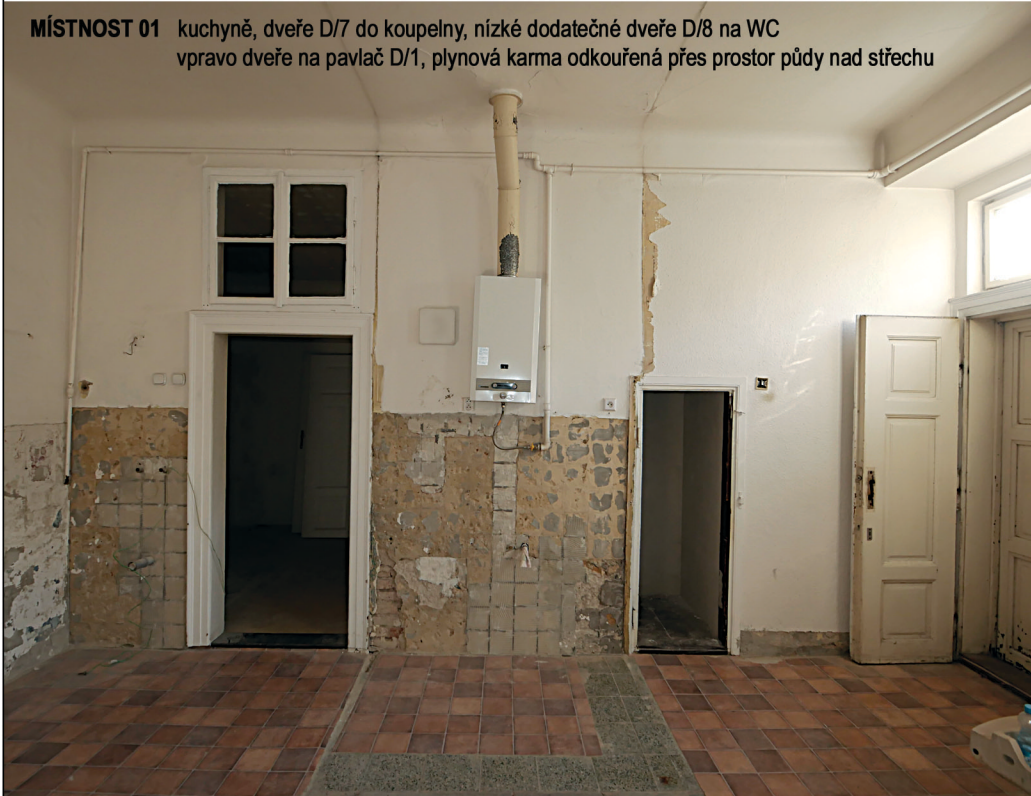
MÍSTNOST 01 kuchyně, dveře D/7 do koupelny, nízké dodatečné dveře D/8 na WC vpravo dveře na pavlač D/1, plynová karma odkouřená přes prostor půdy nad střechu