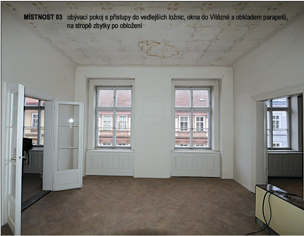
MÍSTNOST 03 obývací pokoj s přístupy do vedlejších ložnic, okna do Vítězné s obkladem parapetů, na stropě zbytky po obložení