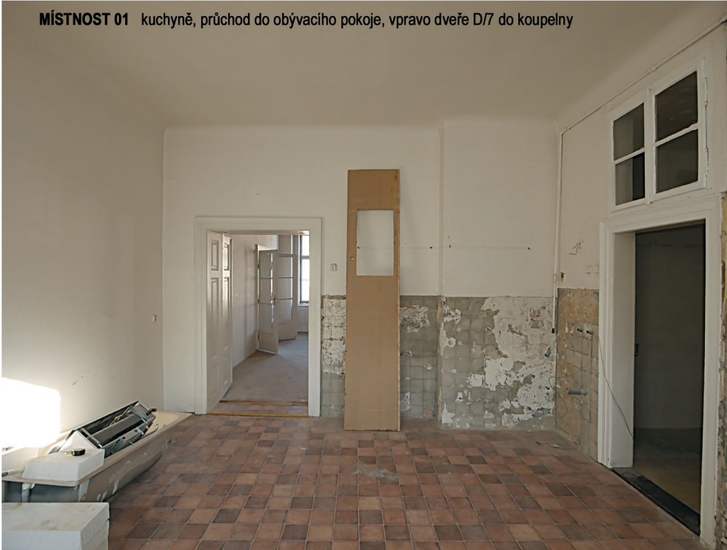
MÍSTNOST 01 kuchyně, průchod do obývacího pokoje, vpravo dveře D/7 do koupelny