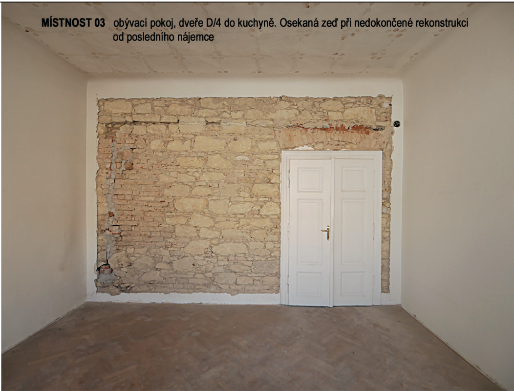
MÍSTNOST 03 obývací pokoj, dveře D/4 do kuchyně. Osekaná zeď při nedokončené rekonstrukci od posledního nájemce